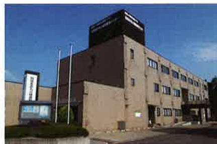
附属あおり健康管理センター

人間ドック専門の施設です。通常の健診より内容の充実した健診項目で、ゆったりとお過ごしいた だきます。 事業所・健保組合の人間ドックにも対応して います。