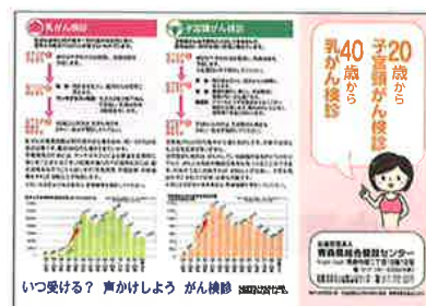
日本対がん協会発行 がん検診リーフレット（左）・乳がんのセルフチェック（右）