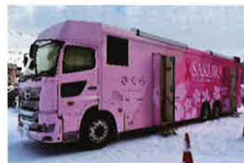
乳房X線デジタルシステム搭載検診車「さくら」