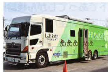
胃X線デジタルシステム搭載検診車「しあわせ」