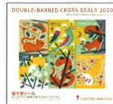
2020年度複十字シール (小型シール)