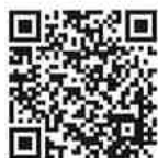
青森県よろこびの会 ホームページ