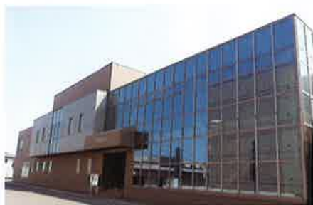
附属あおり人間ドックセンター

この度、下記2施設で新しい検査項目が加わりましたのでご紹介します。 健診をお受けになる際は、ぜひご利用ください。