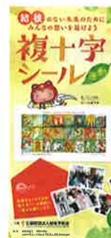
複十字シールリーフレット