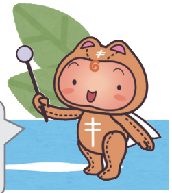
複十字シール運動イメージキャラクター シールぼうや

結核とは、結核菌によって主に肺に炎症が起きる病気です。最初は風邪に似た症状で始まりますが、下記いずれかにあてはまる場合は、早めに受診しましょう。