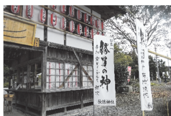
勝負の神として有名な秋保神社を参拝しました

宮城県仙台市秋保温泉宿泊(懇親会開催)～宮城県内見学(秋保大滝、秋保神社、一ノ蔵工場見学等)