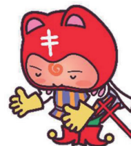
複十字シール運動イメージキャラクター シールぼうや