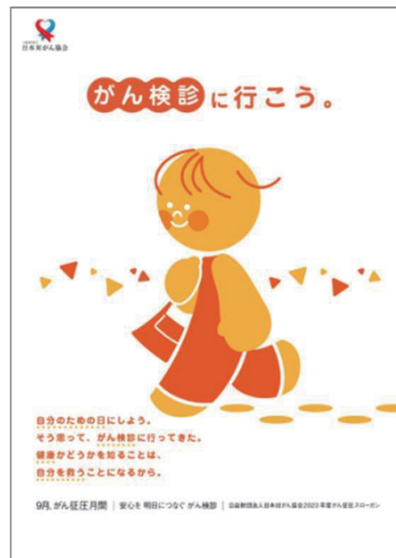
2023年度がん征圧ポスター