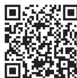
複十字シール募金 専用申込みフォーム