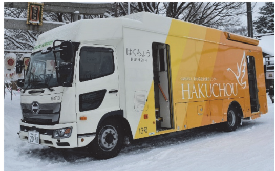
胸部検診車 13号「はくちょう」